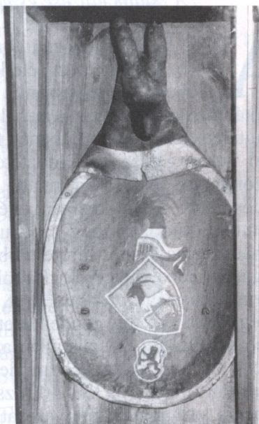
Gaissel Henrik címerpajzsa, a Bencés templomban