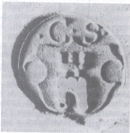
Sopron város ezüst pecsétnyomója 1530-ból