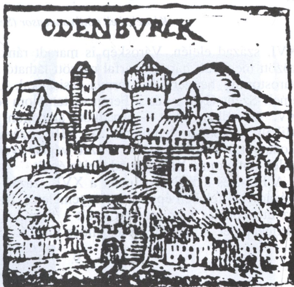
Sopron város fametszetes látképe. 1562-től 150 évig megjelent a bécsi naptárakban

súlyosságát a Jagellók koráig. A királyok viszont különféle kedvezményekkel igyekeztek városuk polgárait haszonvételekhez juttatni. Lássuk a társadalmi-gazdasági fejlődést néhány adatsoron. Sopron lakossága 1379-ben mintegy 1000–1200 fő volt, viszont 2800 főre tehető a XV. század közepén. 128 Ekkor a városban már 40 féle ipari foglalkozású adófizető volt, számuk 180, az adófizető lakosságnak 24,3%-a. Így Sopron valóságos város. A század végére az