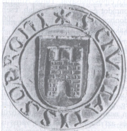
A „kisebb bíró” pecsétnyomója. A körirat Mátyás király korabeli. (vö. a 29. és a 126. számú jegyzet)